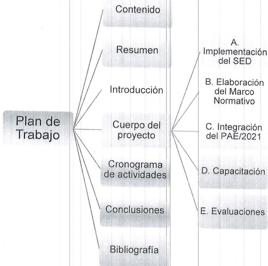
Ilustración 1. Eje temático del Plan de Trabajo.

Con el propósito de darle mayor facilidad al lector, a continuación, se presenta la ilustración número 1, que muestra el eje temático del proyecto, que a su vez indica el orden que seguirá la presentación de este.