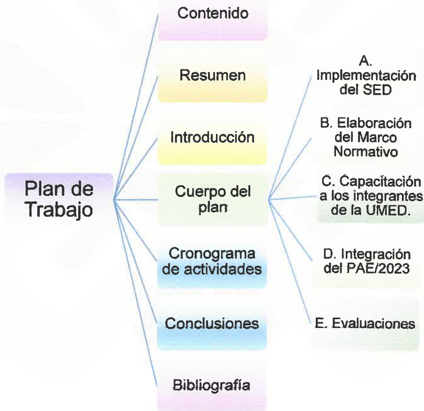
Ilustración 1. Eje temático del Plan de Trabajo.

Con el propósito de dar facilidad, a continuación, se presenta la ilustración número 1, que muestra el eje temático del plan de trabajo, que a su vez indica el orden que seguirá la presentación de este: